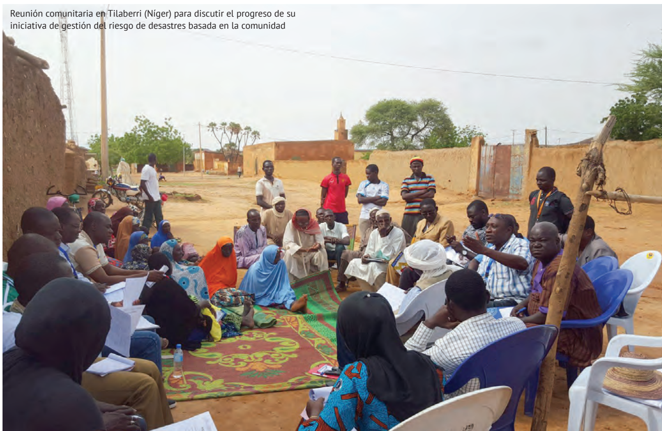
Reunión comunitaria en Tilaberri (Níger) para discutir el progreso de su iniciativa de gestión del riesgo de desastres basada en la comunidad

El manual se fundamenta en una serie de fuentes, entre las que se incluyen el Memorando y el Acta Constitutiva de GNDR (ver sitio web) y el Manual de Gobernanza anterior elaborado por la primera Junta Global en marzo del 2015. También se basa en las buenas prácticas establecidas por otras redes del sector y, cuando corresponde, en las publicaciones sobre buena gobernanza de la Comisión de Organizaciones de Beneficencia del Reino Unido [Charity Commission].