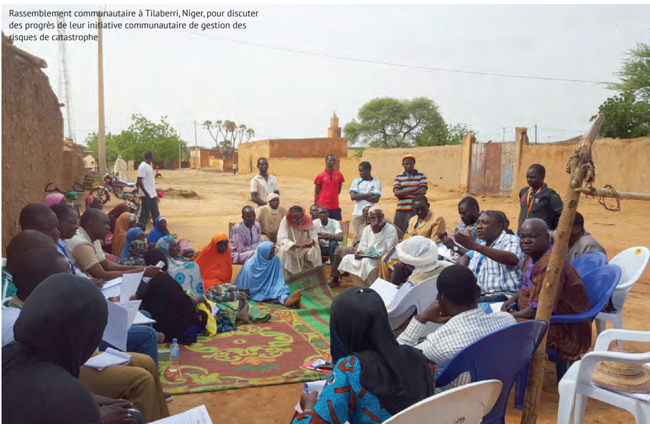
Rassemblement communautaire à Tilaberri, Niger, pour discuter des progrès de leur initiative communautaire de gestion des risques de catastrophe

Le manuel s'inspire de tout un éventail de sources, notamment le Mémorandum and Articles of Association de GNDR (Statuts de l'association - voir site Web) et un précédent Manuel de gouvernance élaboré pour le premier Conseil mondial en mars 2015. Il s'inspire également des bonnes pratiques établies par d'autres réseaux du même secteur et, sur certains points, des publications de la Charity Commission sur la bonne gouvernance.